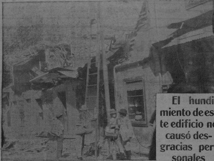
El hundimiento de este edificio no causó desgracias personales